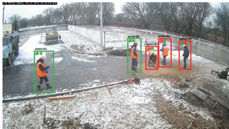
РИС. 1. ◀ Пример работы модуля обнаружения людей и контроля использования СИЗ

Система машинного зрения выявляет на видеоизображении людей. В случае появления человека в заданной опасной зоне подается предупредительный сигнал, к примеру, на пульт начальника смены или крановщику. Также возможна подача предупреждающего звукового сигнала работнику, находящемуся в опасной