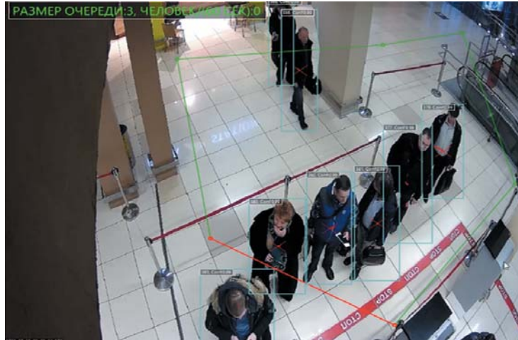
РИС. 4. ◀ Пример работы модуля оценки длины очереди и скорости обслуживания

Подобное решение применимо не только для промышленных или строительных предприятий. В аэропортах, банках и на многих других